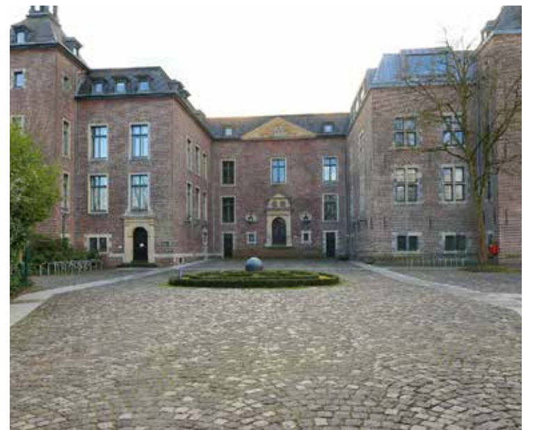
modern şehir yaşamını sakin ve düzenli bir çevreyle birleştiren, ekonomik açıdan güçlü ve yaşanabilir bir Alman şehridir. Hem iş imkanları