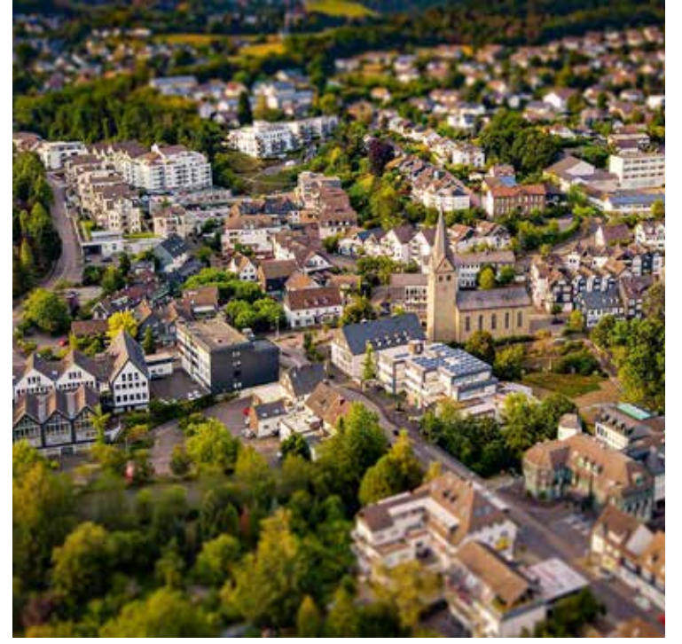
ama aynı zamanda erişilebilir bir yaşam arayanlar için

Sonuç olarak Wiehl, doğanın içinde huzurlu bir yaşam sunan, tarihi ve kültürel değerlerini koruyan bir Alman kasabasıdır. Büyük şehirlerin karmaşasından uzak, sakin