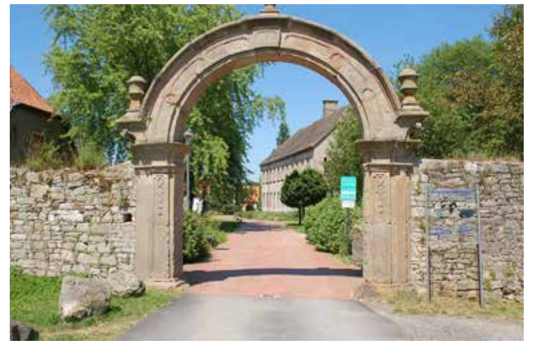
rültüden uzak, doğayla iç içe ve güvenli bir ortam sunması, kasabayı aileler ve emekliler için cazip hale getirir.

Eğitim ve yaşam kalitesi açısından Willebadessen, özellikle huzurlu bir yaşam arayanlar için uygundur. Gü-