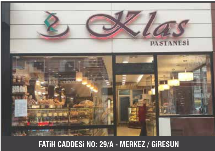
FATİH CADDESİ NO: 29/A - MERKEZ / GİRESUN

Güzel günler göreceğimize inanıyoruz ve umut ediyoruz. Dualarımız ve çabamız hep daha iyi olmak için.