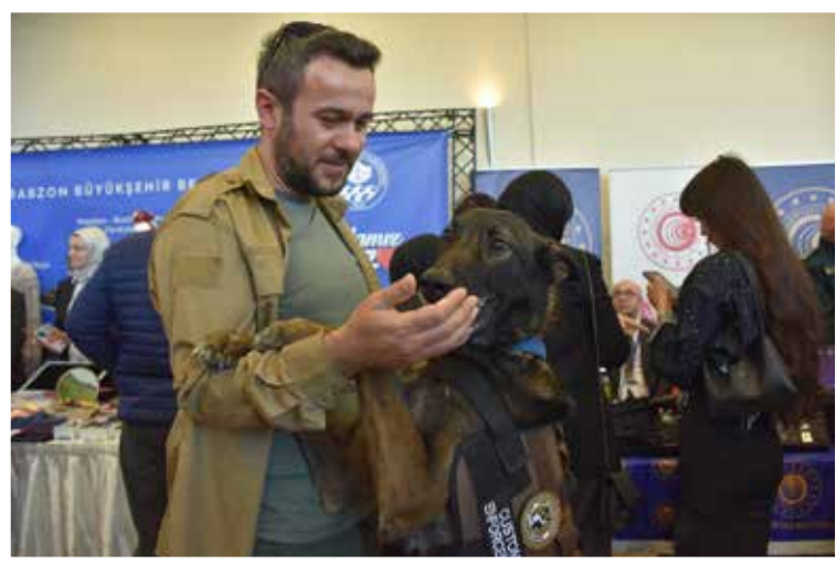
bir konuma sahip olduğunu vurguladı. Ertem, bu yönüyle Trab-