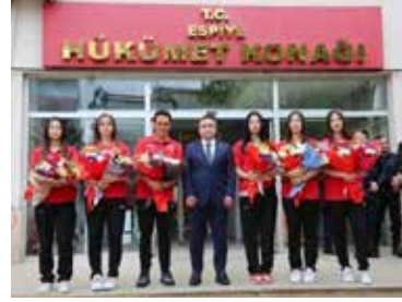
şılama töreni düzenlendi. Haber: Fikret Bıyık