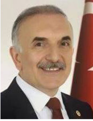
Konferansın en dikkat çeken ismi ise kanser araştırmacısı ve Geleneksel Tamam-

Giresun Üniversitesi'nde gerçekleştirilmesi planlanan konferansta; erken teşhisten korunma yöntemlerine, modern tedavilerden destekleyici uygulamalara kadar hayati başlıklar masaya yatırılacak.