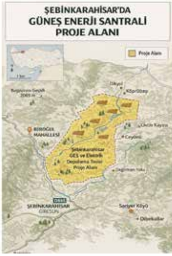
2026 tarihinde Halkın Katılım Toplantısı düzenleneceği duyuruldu.

Şimdi ise aynı şirket tarafından farklı bir alan için yeniden başvuru yapıldığı ve 31 Mart