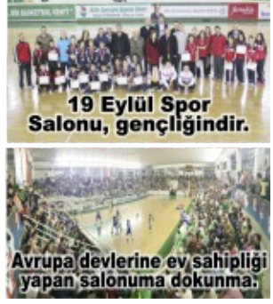
Avrupa devlerine ev sahipliği yapan salonuma dokunma.