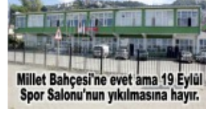
Millet Bahçesi'ne evet ama 19 Eylül Spor Salonu'nun yıkılmasına hayır.