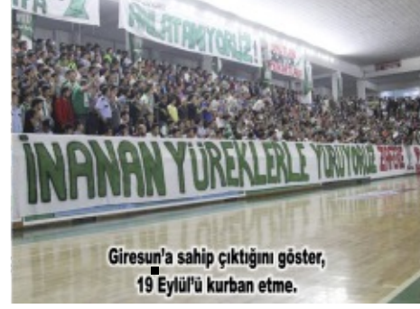
Giresun'a sahip çıktığını gösteren 19 Eylül'ü kurban etme.