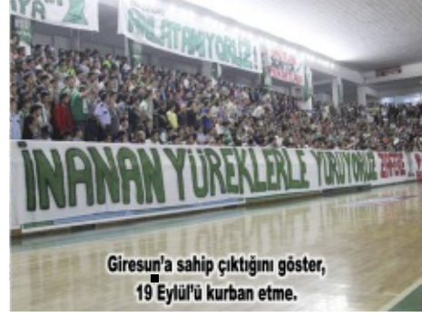
Giresun'a sahip çıktığını gösteren 19 Eylül'ü kurban etme.