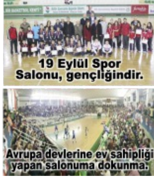
Avrupa devlerine ev sahipliği yapan salonuma dokunma.

Bölgesel Amatör Lige giriş için süre bugün doluyor. Eynesil Belediyespor lige girmeyecek, 1926 Bulancakspor ve Batlamaspor ise işi son dakikaya bıraktı.