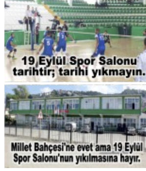
19 Eylül Spor Salonu tarihî fotoğrafı; tarihi yıkmayın.