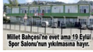
Millet Bahçesi'ne evet ama 19 Eylül Spor Salonu'nun yıkılmasına hayır.