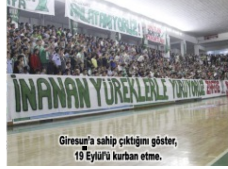
Giresun'a sahip çıktığını göster, 19 Eylül'ü kurban etme.