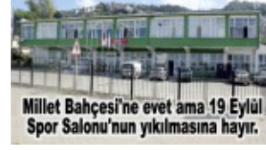
Millet Bahçesi'ne evet ama 19 Eylül Spor Salonu'nun yıkılmasına hayır.