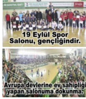
Avrupa devletlerine ev sahipliği yapan salonuma dokunma.