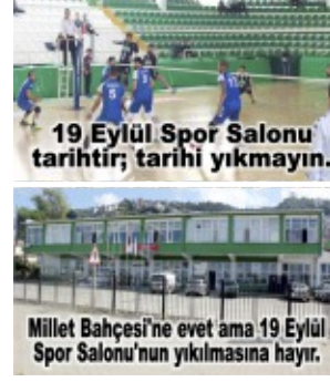
19 Eylül Spor Salonu tarihî fotoğrafı.