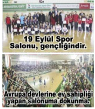
Avrupa devlerine ev sahipliği yapan salonuma dokunma.