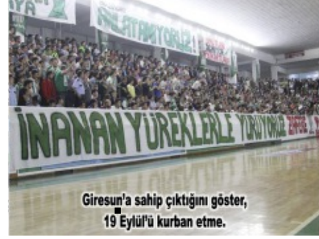
Giresun'a sahip çıktığını gösteren 19 Eylül'ü kurban etme.