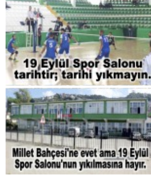
19 Eylül Spor Salonu tarihî fotoğrafı.