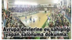
Avrupa devletlerine ev sahipliği yapan salonuma dokunma.