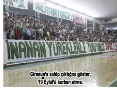
Giresun'a sahip çıktığını göster, 19 Eylül'ü kurban etme.