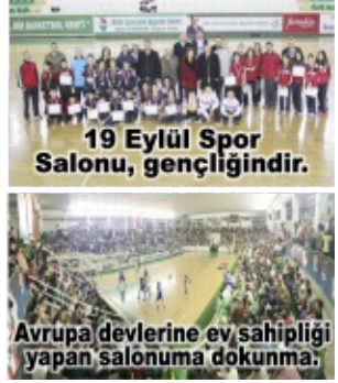
19 Eylül Spor Salonu, gençliğinindir.