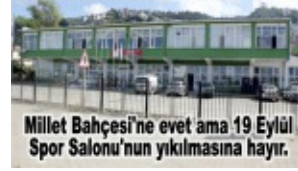
Millet Bahçesi'ne evet ama 19 Eylül Spor Salonu'nun yıkılmasına hayır.