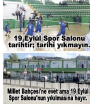
19 Eylül Spor Salonu tarihî fotoğrafı.