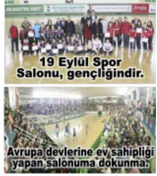
19 Eylül Spor Salonu, gençliğindir.