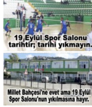
19 Eylül Spor Salonu tarihî fotoğrafı.