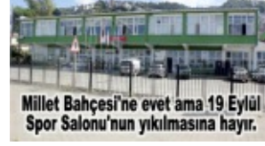
Millet Bahçesi'ne evet ama 19 Eylül Spor Salonu'nun yıkılmasına hayır.