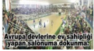
Avrupa devlerine ev, sahipliği yapan salonuma dokunma.

Giresun Barosu Kadın Voleybol Takımı, Amasya Barosu ile deplasmanda yaptığı maçtan 3-0 galip ayrıldı ve namağlup liderliğini sürdürdü