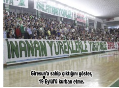
Giresun'a sahip çıktığını göster, 19 Eylül'ü kurban etme.