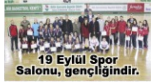
19 Eylül Spor Salonu, gençliğindir.