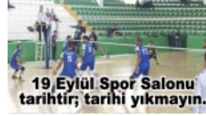
19 Eylül Spor Salonu tarihî fotoğrafı, tarihi yıkmayın.