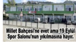
Millet Bahçesi'ne evet ama 19 Eylül Spor Salonu'nun yıkılmasına hayır.