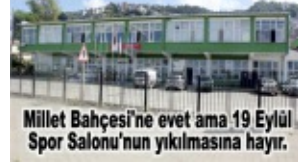
Millet Bahçesi'ne evet ama 19 Eylül Spor Salonu'nun yıkılmasına hayır.