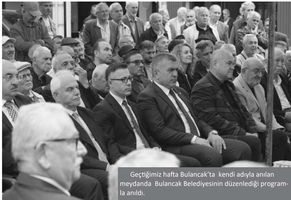
Geçtiğimiz hafta Bulancak'ta kendi adıyla anılan meydana Bulancak Belediyesinin düzenlediği programla anıldı.