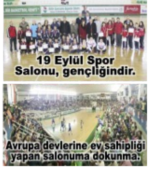
Avrupa devlerine ev sahipliği yapan salonuma dokunma.