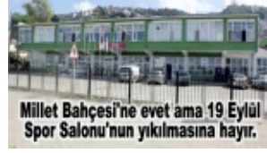
Millet Bahçesi'ne evet ama 19 Eylül Spor Salonu'nun yıkılmasına hayır.