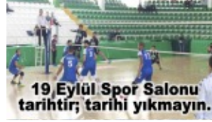
19 Eylül Spor Salonu tarihî fotoğrafı, tarihi yıkmayın.