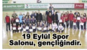
19 Eylül Spor Salonu, gençliğindir.