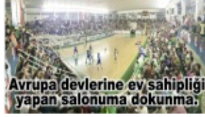
Avrupa devlerine ev sahipliği yapan salonuma dokunma.

Bölgesel Amatör Lig'de mücadele eden 1926 Bulancakspor, sezonu tesiste yaptığı etkinlik ile kapattı